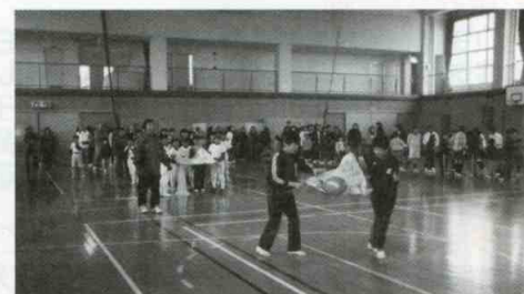
ふれあいスポーツ大会