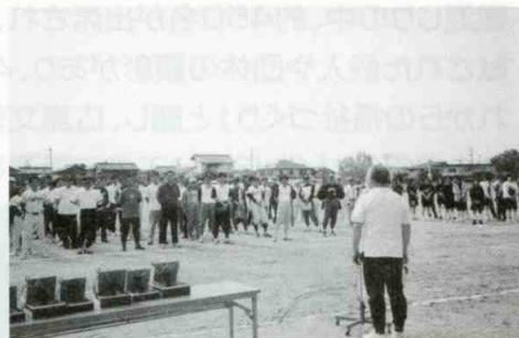
グラウンドゴルフ会