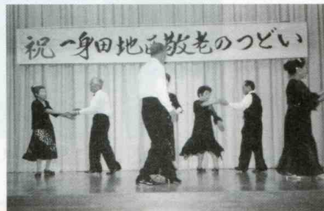
敬老のつどい(健康ダンスの会の舞台)

3.協賛事業として、8月には夏の風物詩「盆おどり大会」と「行灯コンクール」を高田本山境内と寺内町で開催しており、また11月には「寺内町まつり」を本山門前を主会場にして開催、寺内町一帯は祭り一色で大変な賑わいとなります。