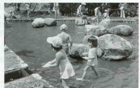
子育て支援事業「魚つかみ大会」