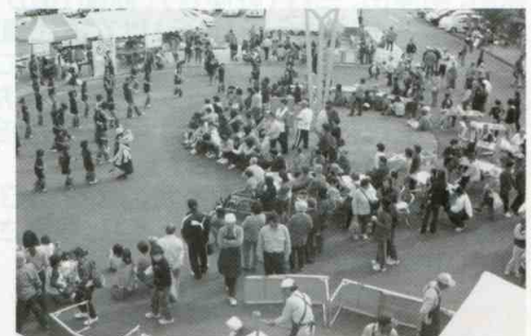
白山けんこうふくし子育てフェスタ

住民の声と力を一つに『小地域での支えあい活動』を進めていきたいです。また、子育て支援事業や障がい児支援事業など児童福祉分野にも力を入れていき、子供から高齢者までみんなが笑顔になれる地域づくりをめざしていきたいと思います。