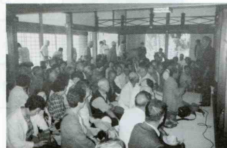
高齢者の生きがいづくり(講話の聴講)