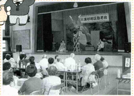
美杉地区(八知)敬老会の様子