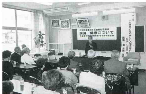
「健康について」講演会事業