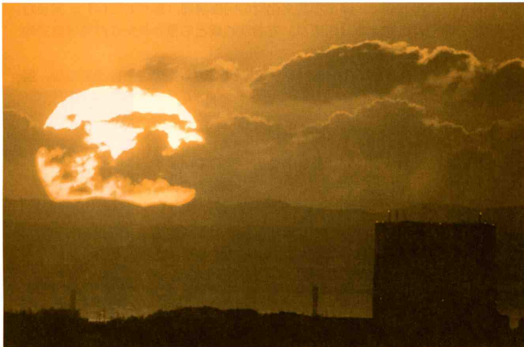
朝日をうける津の街