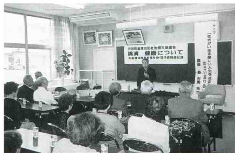
「健康について」講演会事業