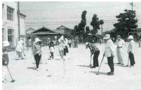
地域ふれあいグランドゴルフ大会