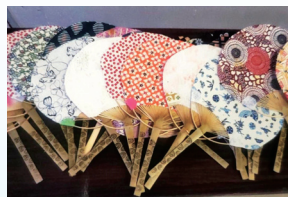
◀みんなで協力して作った作品

多世代で集まることができるサロン。そこには顔の見える関係があり、防犯、防災にも強い地域づくりの拠点となっています。