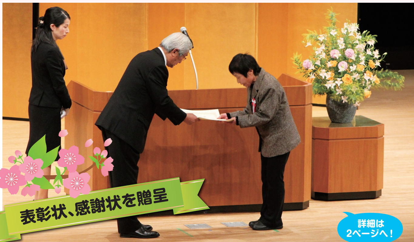
表彰状、感謝状を贈呈