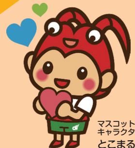
マスコット キャラクター とこまる