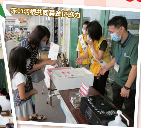
赤い羽根共同募金に協力