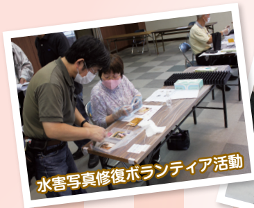
水害写真修復ボランティア活動