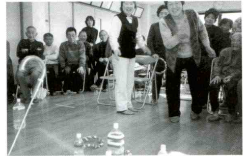
いきいきサロンの輪投げ

少子高齢化がさらに進みつつあるなかで、自治会、民生委員児童委員、老人会、学校などと協力しあいながら、生きがいのある元気な地域に発展させていきたいと考えています。