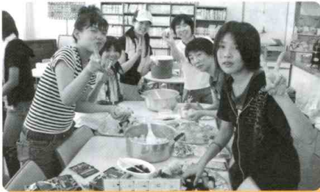
ワーク活動 楽しい食事づくり

ボランティア活動を通して、施設利用者とのふれあい、福祉への理解を深める貴重な体験となりました。