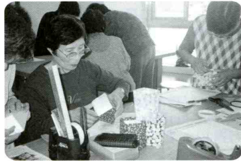
ボランティアグループ秋桜会 施設利用者の方へ贈るための筆立てを製作しているようす