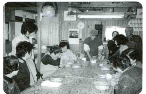
音声訳ボランティアグループ「ヴォイスあろう」とリスナーとの交流会