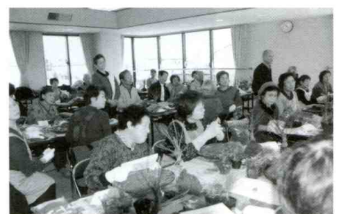
寄せ植えの園芸教室

地域の安全と美化運動に重点を置き、海岸清掃、防災事業に全力を尽し、地域のみなさんが安心して、心豊かに暮らせる地域づくりに貢献していきたいと思っています。