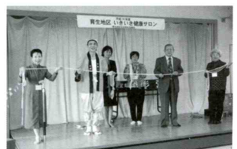
いきいき健康サロン