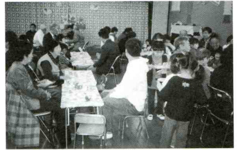
幼稚園児とのふれあい