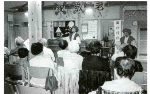
老人福祉施設訪問

地域活動に対する呼びかけを行い、より多くの人に参画してもらうことによる地域の活性化とふれあいの輪をさらに広げていきたいと思っています。