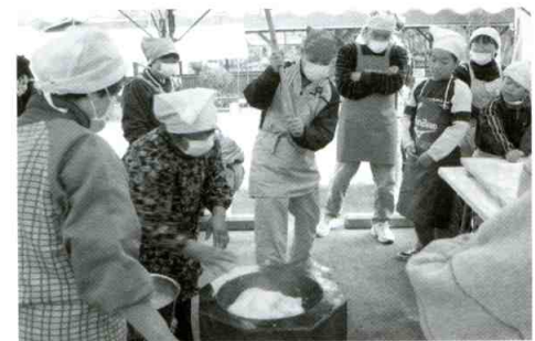
歳末餅つき大作戦

美杉地区では過疎化・少子高齢化の中で、高齢者が高齢者を支えあわなければならない現実があり、日増しに厳しい状況におかれています。その中で美杉地区社協は美杉地区で活動している各団体や学校、地域のみなさまのご尽力をいただきながら「しあわせ」と「ゆたかさ」を求めて活動していきたいと思ひます。