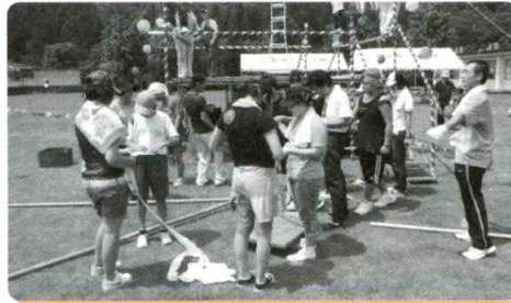
ワーク活動 いよいよ会場準備