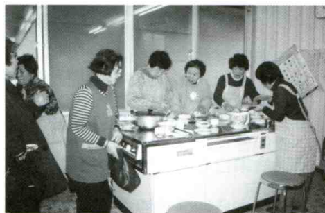
高齢者健康料理教室