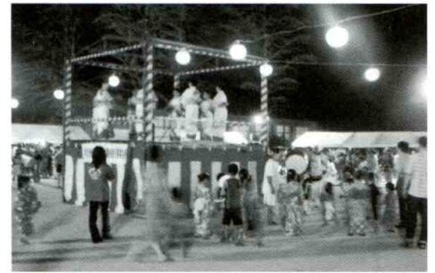
ふれあいまつりの子ども御輿・総おどり