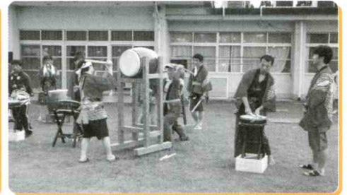
納涼大会 いなば太鼓で開会!