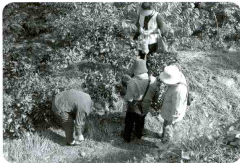
「ひとり暮らし高齢者の集い」で みかん狩りへ