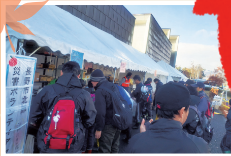
(写真は今までの様子です)