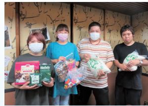
▲社協へ寄附いただいた食料を団体へお渡ししました。▲