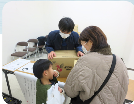
ひとり親家庭食料配付