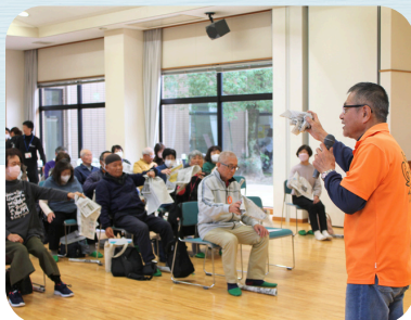
ふれあい・いきいきサロン講習会