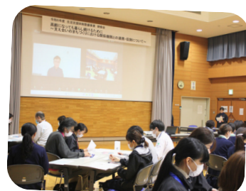
生活支援体制整備事業 研修会