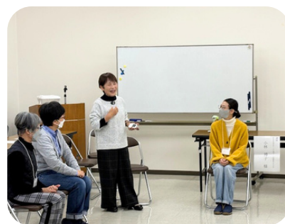
ボランティア講座