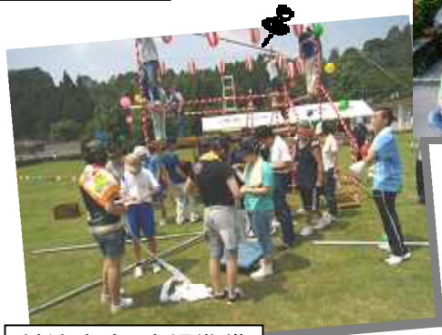
納涼大会 会場準備

去年より大勢の方に参加していただき、 いなば園のみなさんも、とてもうれしそうでした。 参加していただいたみなさんにとっても、 今年の夏はちょっとちがって輝く夏に... なったのでは？