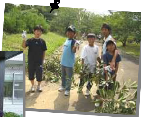
木の剪定のお手伝い