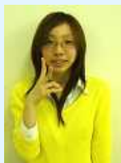
2008 車イス体験ふれあいウォークラリー大会実行委員会の長 (通称あやばん)