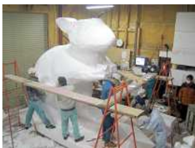
昨年の干支「子」制作の様子

メンバーは大工・左官・職人・会社員・公務員、最近では小学生の参加もいただいています。