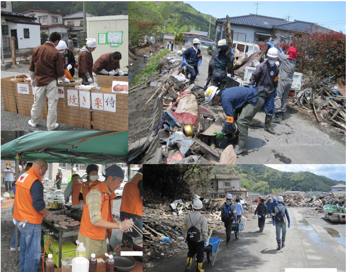
岩手県大槌町のボランティア活動