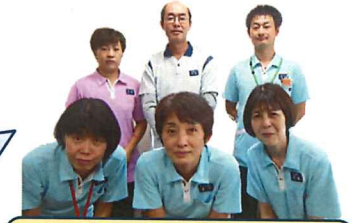
津北部西地域包括支援センターのみなさん

「覚えられない」「忘れてしまう」「ここはどこ?」「あなたは誰?」...どんな気持ちになるでしょう? 1番心配で、苦しんでいるのは認知症になった本人です。