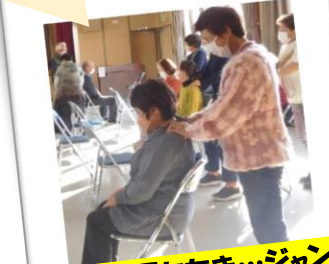
じゃんけん肩たたき…じゃんけんに 勝つと肩をたたいてもらえる

令和5年11月28日(火)にサロン交流会を開催しました。サロン関係者同士の交流は、新たなつながりの良い機会となり、コロナ禍で制限されていた人と人とのふれあいの大切さを改めて実感できました。