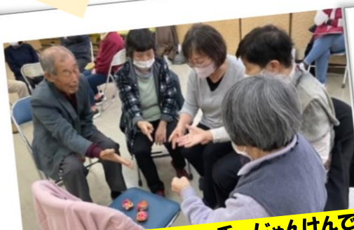
じゃんけんでお手玉キャッチ…じゃんけんで 勝負がついたら、全員でお手玉を取りに行く