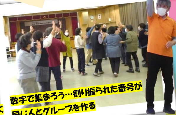
数字で集まろう…割り振られた番号が 同じ人とグループを作る